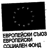
Схема за предоставяне на безвъзмездна помощ BG05M9OP001-2.002 „Независим живот“ Проект № BG05M9OP001-2.002-0169-C001 “Подкрепа за независим живот на възрастни и лица с увреждания”