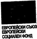
Схема за предоставяне на безвъзмездна помощ BG05M9OP001-2.002 „Независим живот“ Проект № BG05M9OP001-2.002-0169-C001 “Подкрепа за независим живот на възрастни и лица с увреждания”