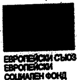
Схема за предоставяне на безвъзмездна помощ BG05M9OP001-2.002 „Независим живот“ Проект № BG05M9OP001-2.002-0169-C001 "Подкрепа за независим живот на възрастни и лица с увреждания"