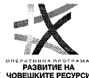
Схема за предоставяне на безвъзмездна помощ BG05M9OP001-2.002 „Независим живот“ Проект № BG05M9OP001-2.002-0169-C001 “Подкрепа за независим живот на възрастни и лица с увреждания”

ЕВРОПЕЙСКИ СЪЮЗ ЕВРОПЕЙСКИ СОЦИАЛЕН ФОНД