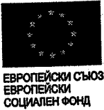
Схема за предоставяне на безвъзмездна помощ BG05M9OP001-2.002 „Независим живот“ Проект № BG05M9OP001-2.002-0169-C001 „Подкрепа за независим живот на възрастни и лица с увреждания“