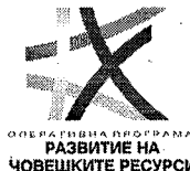
Схема за предоставяне на безвъзмездна помощ BG05M9OP001-2.002 „Независим живот“ Проект № BG05M9OP001-2.002-0169-C001 “Подкрепа за независим живот на възрастни и лица с увреждания”

ОПЕРАТИВНА ПРОГРАМА РАЗВИТИЕ НА ЧОВЕШКИТЕ РЕСУРСИ