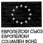
Схема за предоставяне на безвъзмездна помощ BG05M9OP001-2.002 „Независим живот“ Проект-№ BG05M9OP001-2.002-0169-C001 "Подкрепа за независим живот на възрастни и лица с увреждания"