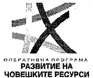
Схема за предоставяне на безвъзмездна помощ BG05M9OP001-2.002 „Независим живот“ Проект № BG05M9OP001-2.002-0169-C001 “Подкрепа за независим живот на възрастни и лица с увреждания”

ОПЕРАТИВНА ПРОГРАМА РАЗВИТИЕ НА ЧОВЕШКИТЕ РЕСУРСИ